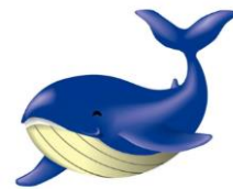
とかしきーケラ丸くん